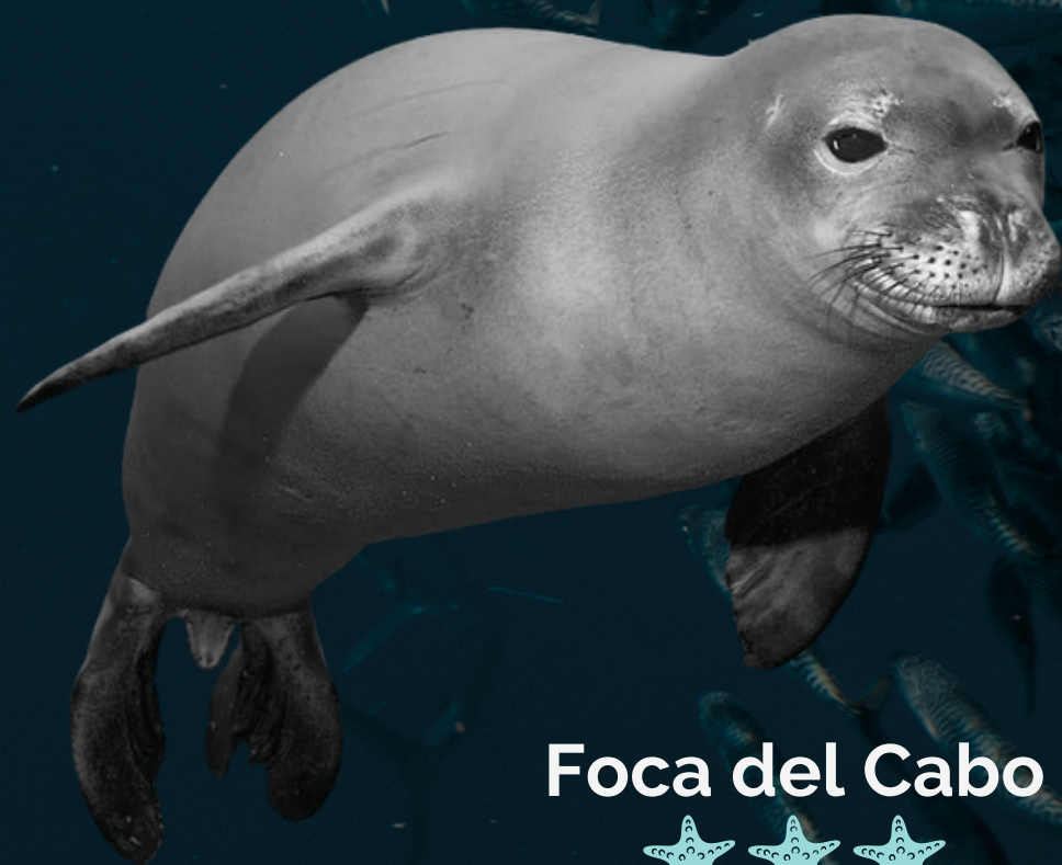
Foca del Cabo