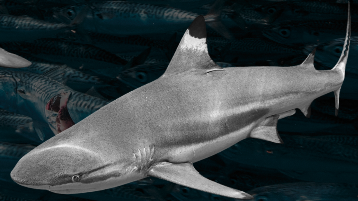
Tiburón Punta Negra Oceánico