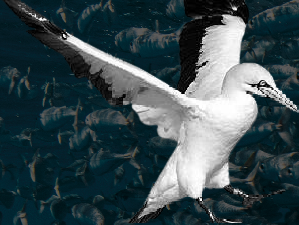
Alcatraz del Cabo